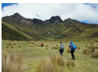
Machachi 📍 Laguna Limpiopungo 📍