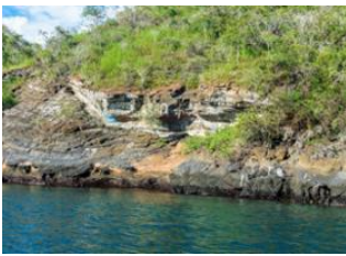
Ile Santa Cruz