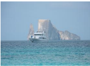
Ile San Cristóbal