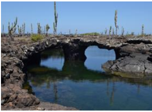
Ile Santa Cruz