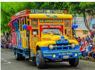
Ile San Cristóbal