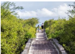
Ile Isabela 📍