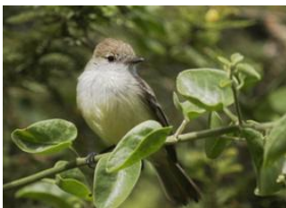
Ile Santa Cruz 📍