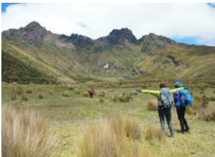
Rumiñahui (4 721 m) 📍 Baños 📍