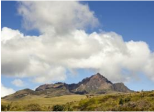
Rumiñahui (4 721 m) 📍